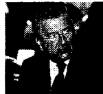
De Benedetti è presidente del Gruppo editoriale L'Espresso