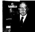
Fedele Confalonieri è capo delle reti Mediaset