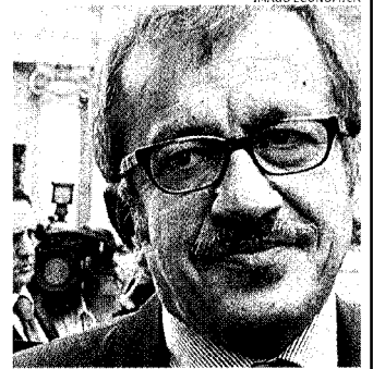
Roberto Maroni , ministro dell'Interno