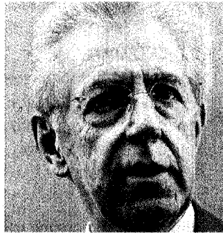
Mario Monti , presidente dell'università Bocconi