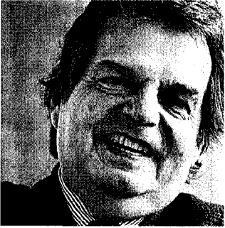
Renato Brunetta , ministro della Pubblica amministrazione