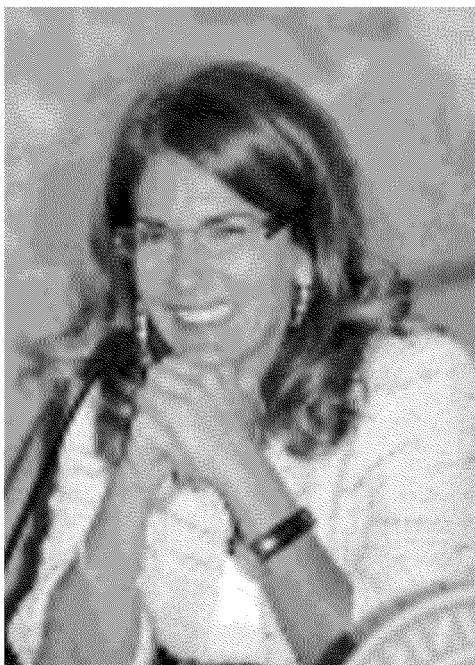
LA LEADER Nella foto a fianco, il nuovo presidente della Confindustria, Emma Marcegaglia, che ieri ha criticato le politiche protezioniste

Monti: l'Europa imponga una gestione multilaterale della globalizzazione