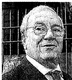
Guido Rossi è stato presidente della Consob, la commissione di vigilanza sulla Borsa

con una proposta che rafforzi alcuni vincoli che in Italia in parte esistono già: «Regolerei le partecipazioni delle banche nelle imprese industriali e viceversa» è la proposta di Guido Rossi. Il direttore della «Stampa» Giulio Anselmi, nelle vesti di intervistatore, ha subito chiesto a Giavazzi se fosse d'accordo e lui, in linea di principio, ha confermato.