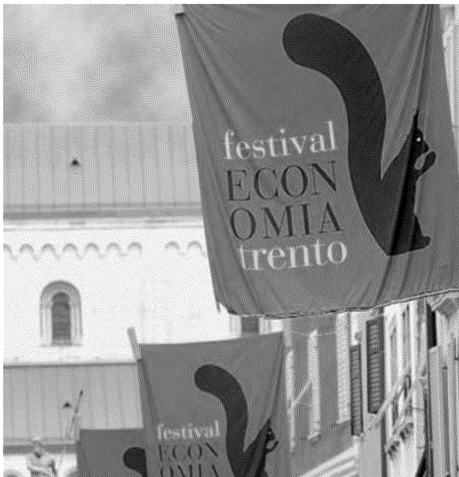
Mascotte Sciattoli del Festival dell'economia in via Belenzani