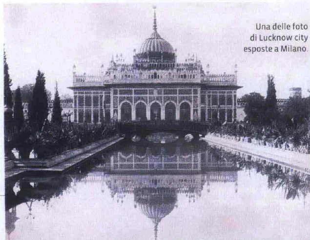
Una delle foto di Lucknow city esposte a Milano.