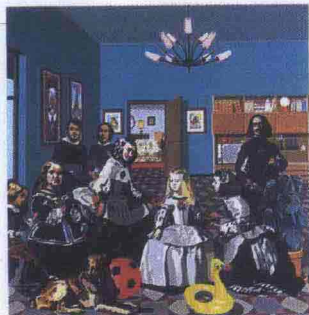
La salita (Las Meninas), 1970, Equipo Crónica, in mostra a Palermo

Milano, Un viaggio in India , Villa Necchi Campiglio, fino all'8 giugno